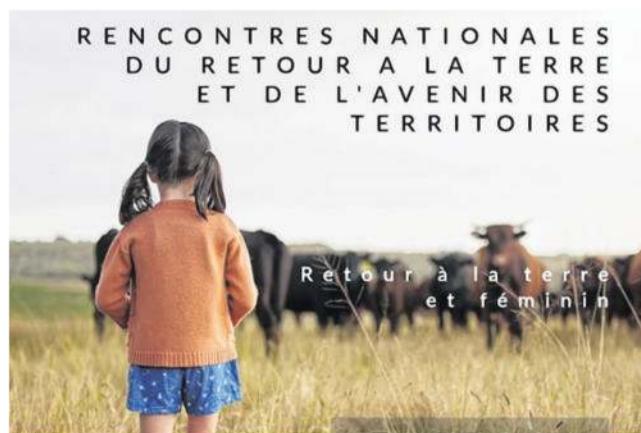
L'affiche des deuxièmes Rencontres nationales DR

Parce que les maraîchers sont aussi — et surtout — de véritables entrepreneurs agricoles, l'ambition de ce parcours métier pensé sur 3 à 4 ans est de former les chef.fes d'entreprises agricoles de demain : une formation et un accompagnement uniques pour apprendre à démarrer et gérer efficacement une ferme agroécologique en polyculture-petit élevage, selon la méthode bio-intensive. Une proposition ultra-complète qui est aujourd'hui inexistante en l'état sur le marché de la formation en France.